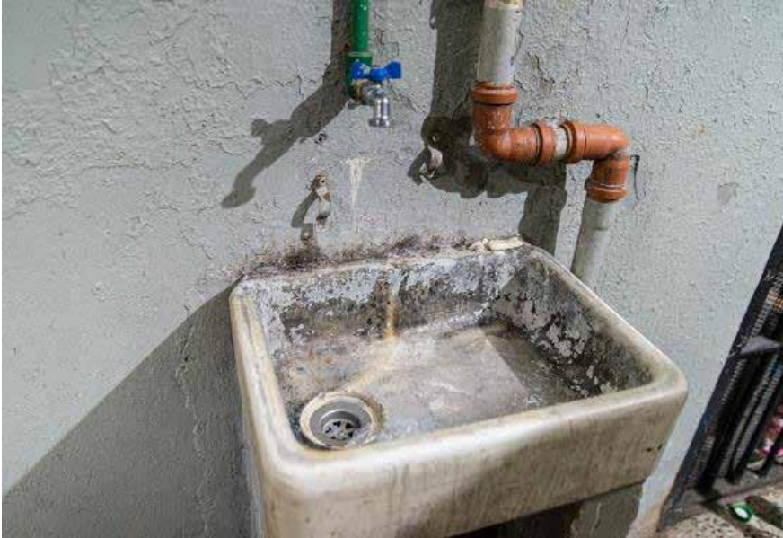
COMISARÍA VECIALN 1- C ANEXO